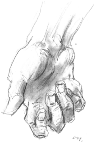
指の形いろいろ (カット・筆者)