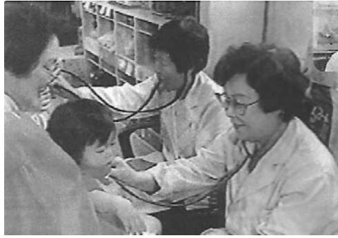
姉(右)と並んで診察する筆者(取材のTVから)

開室日は月曜日～土曜日(祝祭日をのぞく)。時間は午前8時～午後6時まで(土曜は午後2時)。診察の上、入院を要す